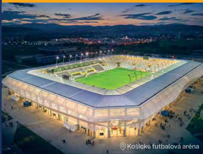
Košická futbalová aréna

Ak vaša cesta z Košíc smeruje do vzdialenejších zemepisných šírok, na Medzinárodné letisko Košice sa zo Staničného námestia dostanete pomocou priamej linky MHD (autobus č. 23). Cesta touto linkou trvá približne 15 minút. Na cestu na letisko môžete využiť aj taxislužbu .